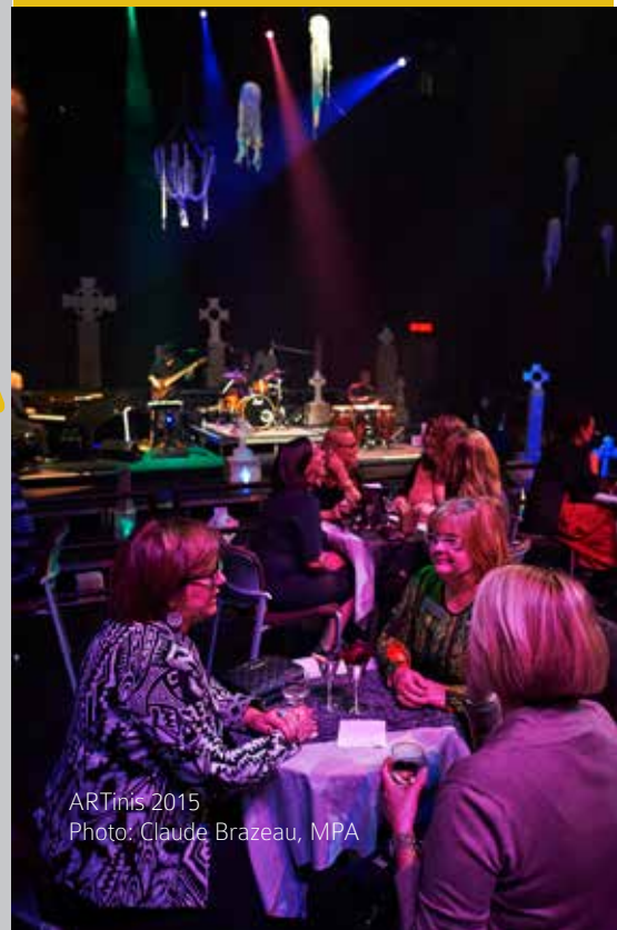
ARTinis 2015