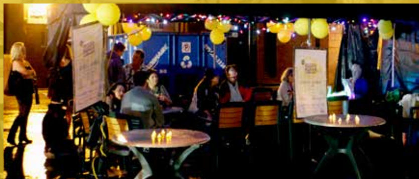
Nuit Blanche Ottawa+Gatineau, la Bibliothèque vivante.

Nous avons présenté l'activité « Artistes en bibliothèque vivante » pour la troisième fois lors de l'événement Nuit Blanche en septembre 2015. 18 artistes de diverses disciplines étaient disponibles et pouvaient être « empruntés » le temps d'une conversation. Plus de 80 personnes ont effectué 85 emprunts et 225 personnes ont visité l'événement. Le Conseil des arts a également soutenu les opérations de NBOG en coordonnant un appel aux candidatures s'adressant aux artistes.